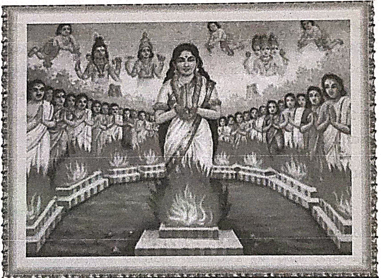
102 గోత్రజ ఆర్యవైశ్య దంపతులు - అగ్నిప్రవేశ దృశ్యము

ఆదర్శమయ జీవనము గడుపుకొనుటకనువైన ధర్మసారమును ఉపదేశించి, ఆత్మీయులందరి వద్ద సెలవుతీసుకొన్నది. ఆమె ఆదేశమును అనుసరించి నూట యిద్దరు పుణ్యదంపతులను కుండములను నిర్మించిన మల్లారుడును, తమకై నిర్దేశింపబడియుండిన అగ్ని కుండముల చెంతకు చేరిరి. వారు తమతమ కుండములకు ముమ్మారు ప్రదక్షిణముగావించి అగ్నిలో ప్రవేశించుటకు సంసిద్ధులై నిలచిరి. జాజ్వల్యమానముగ ప్రకాశించుచున్న ఆ అగ్నికుండముల మధ్య, సమస్త గ్రహోపగ్రహగోళముల మధ్య వెలుగొందుచున్న పరాశక్తి వలె ప్రకాశించుచు వాసవీకన్యక తనకై ఏర్పరచిన ప్రధానాగ్ని కుండము చెంత ధ్యాననిమగ్నమై నిలచినది.