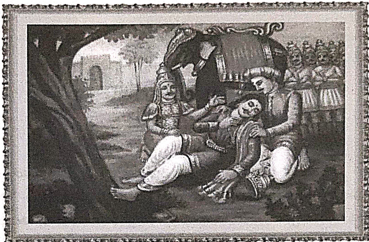
శాపగ్రస్తుడైన విష్ణువర్ధన మహారాజు వాసవి అగ్నిప్రవేశ వార్తను విని, ముక్తినొందుట